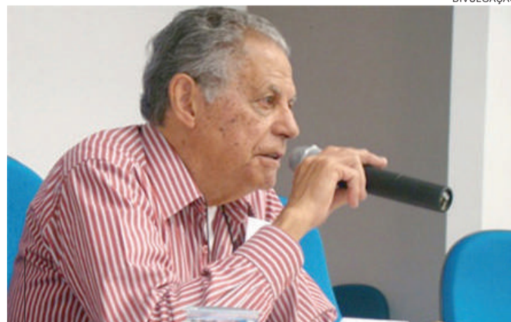
Flávio Villaça é um dos grandes urbanistas brasileiros

A convite do curso de Arquitetura e Urbanismo da Faculdade Assis Gurgacz (CAUFAG), o professor e urbanista Flávio Villaça ministra palestra, na próxima quarta-feira, dia 10 de junho. O evento acontece no anfiteatro da Reitoria, às 19 horas, com o tema: "Planejamento Urbano: Plano Diretor