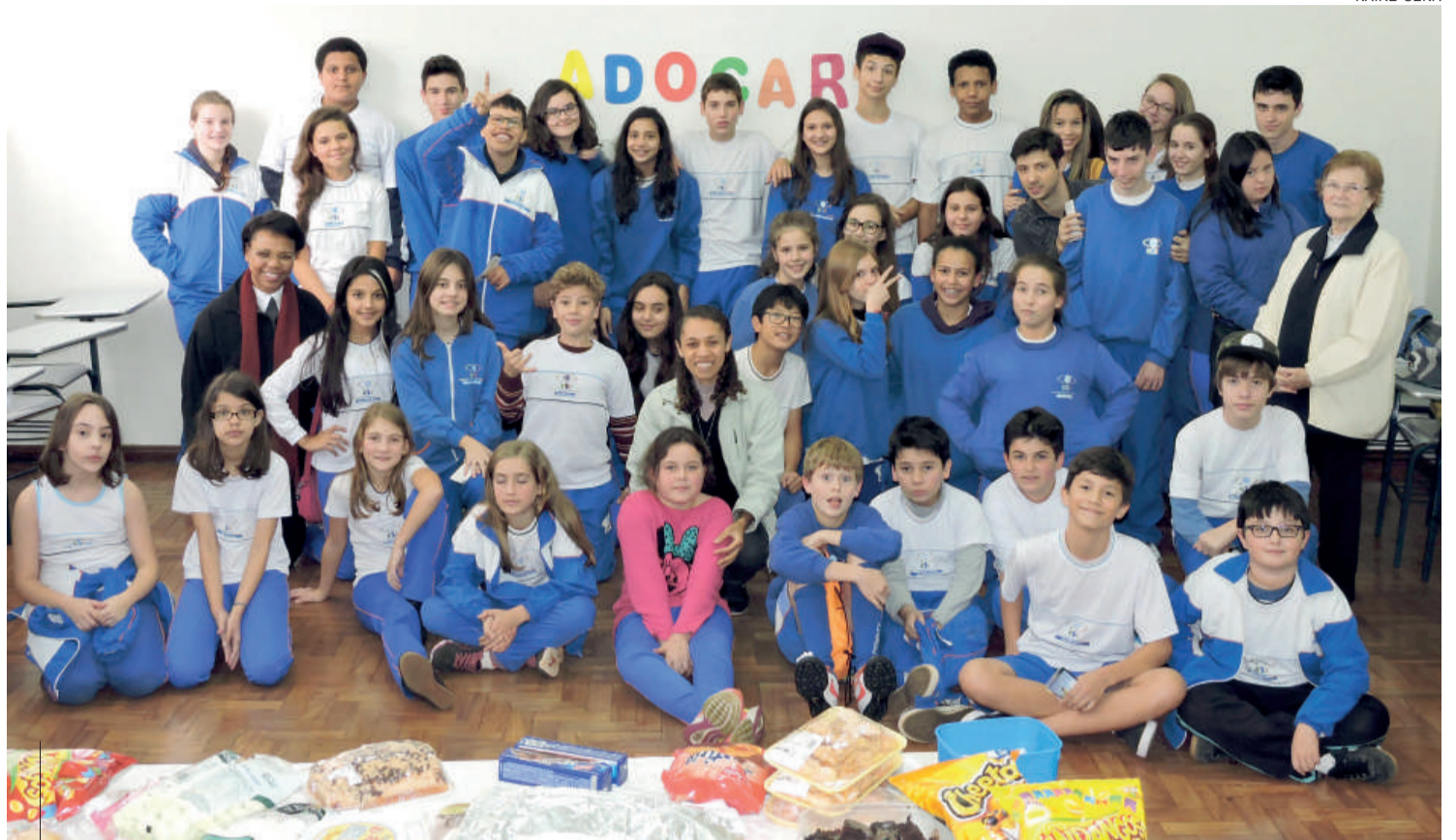
Turma de estudantes que participou do encontro no Colégio ESI