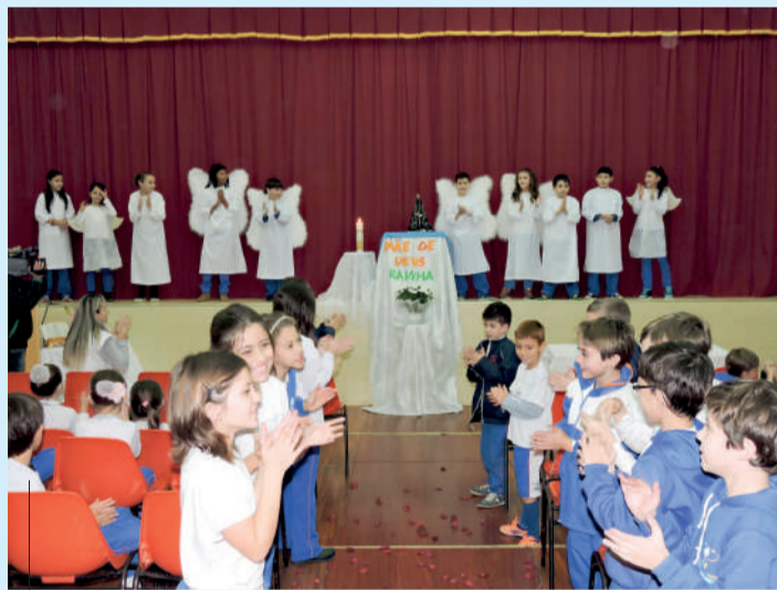
Encenação ocorreu na última aula do mês de maio

"A tradição de coroar a imagem da Virgem Maria no mês de Maio é muito antiga. Este gesto quer externar o carinho que sentimos pela Mãe de Jesus e nossa Mãe. Maria não é Deus, mas é a mãe do Salvador Jesus e aponta para ele. Coroamos a sua imagem, porque em nosso coração ela tem um lugar especial, pois pelo seu 'Sim' nos veio Jesus. Coroamos a imagem de Maria, como gesto simbólico, para aprender com