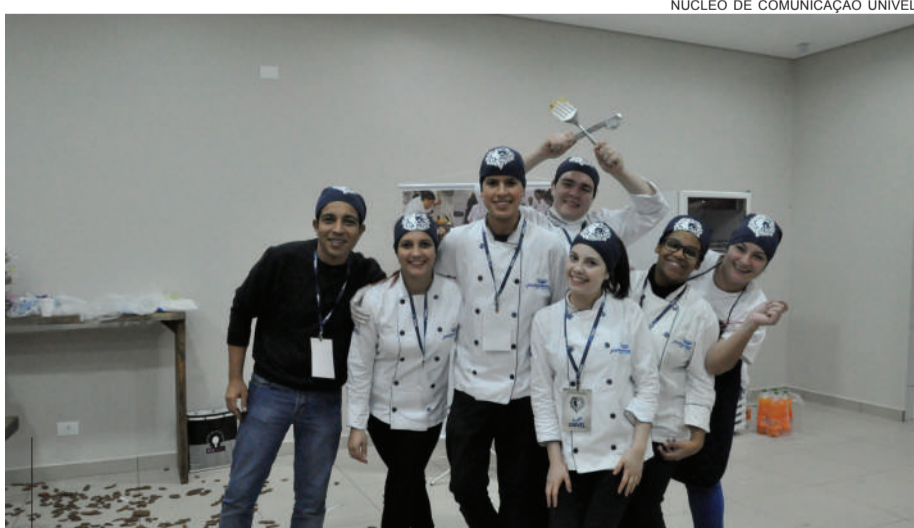
Galera de Gastronomia marcou presença