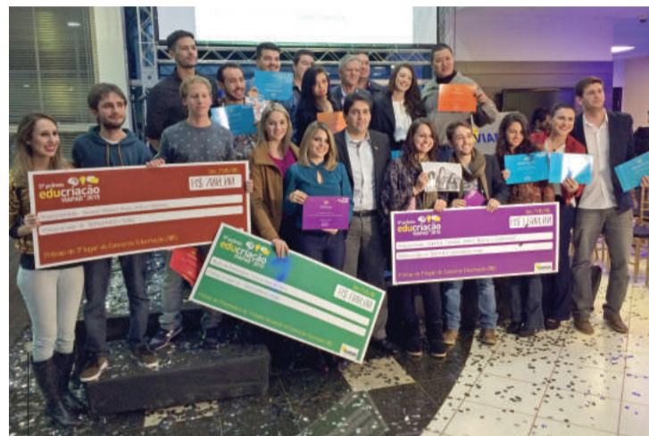
Alunos de Publicidade e Propaganda da FAG comemorando a conquista de dois pódios