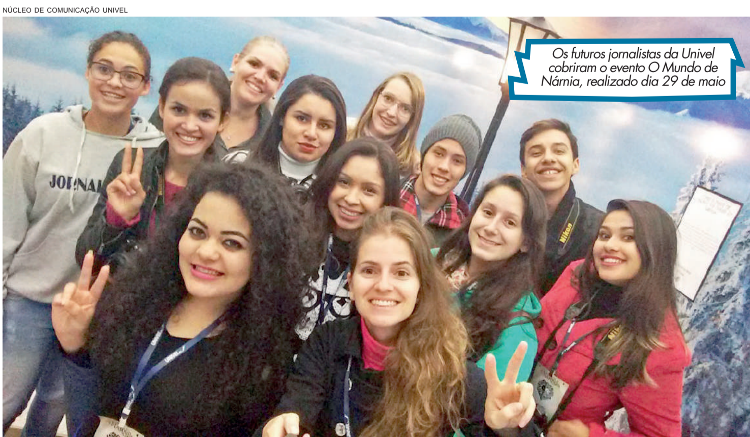
Os futuros jornalistas da Univel cobriram o evento O Mundo de Námia, realizado dia 29 de maio