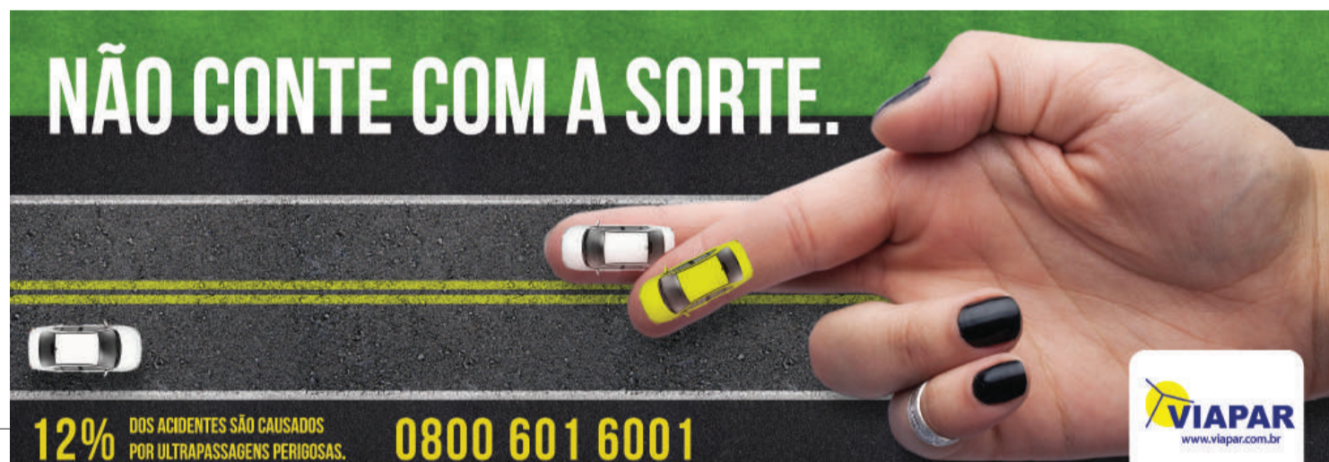
Uma das peças da campanha vencedora