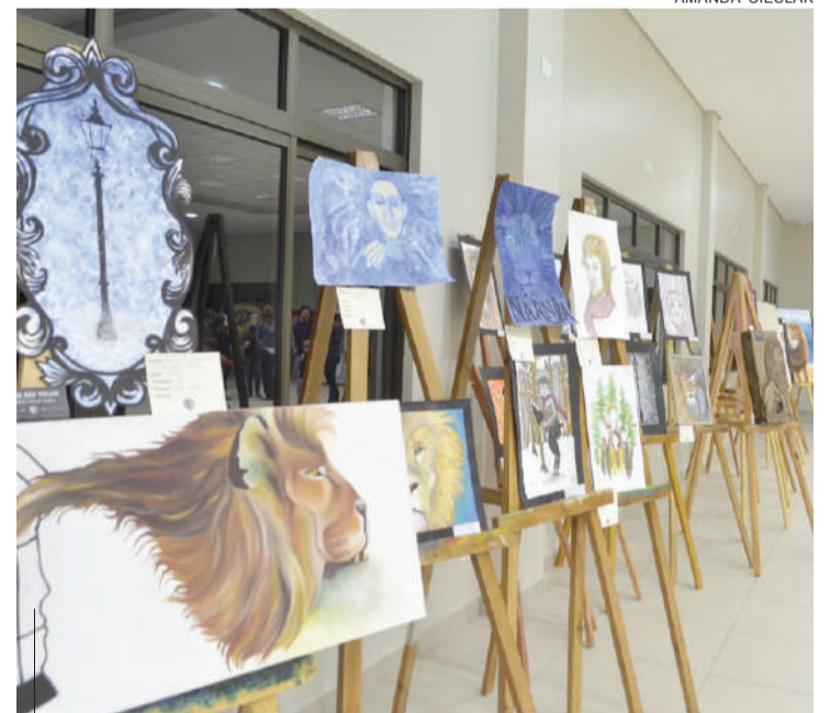
Os quadros da galera de Artes da Univel