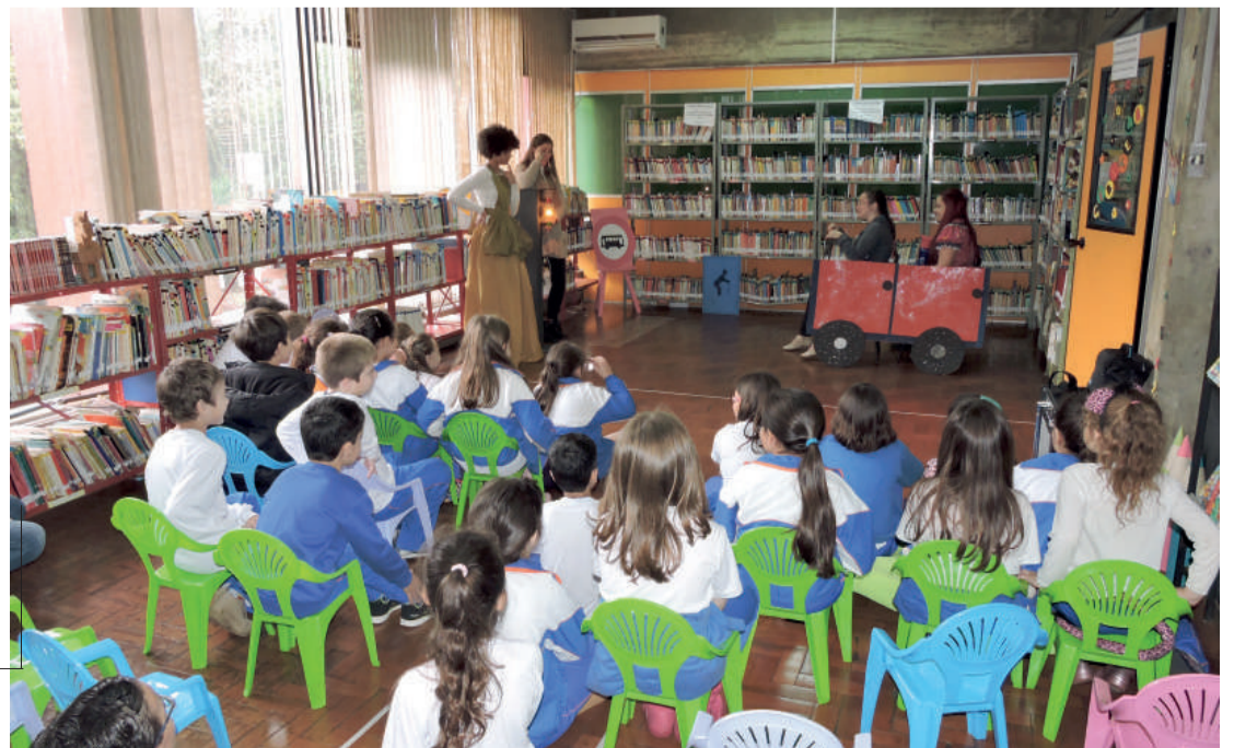
Alunos assistiram ao teatro "Como se comportar no trânsito"

exposição de cerâmicas, produzidas por mulheres indígenas do Paraguai; o acervo de livros; gibiteca; periódicos antigos; a lixoteca, com objetos e brinquedos produzidos com produtos reciclados, e assistiram ao teatro "Como se comportar no trânsito".