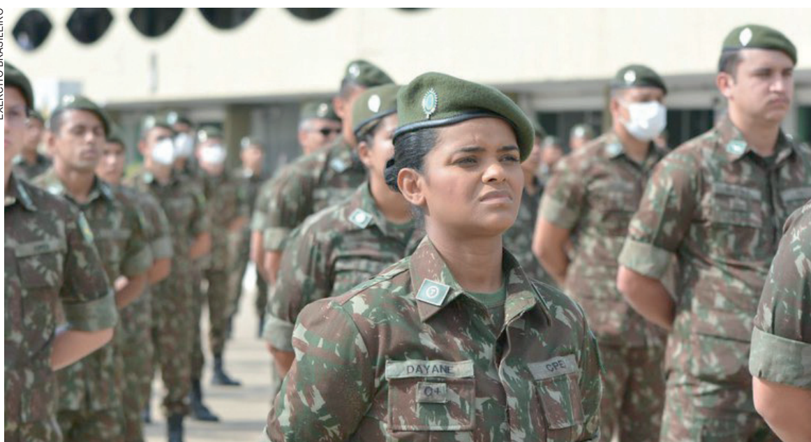
A primeira fase é o alistamento, que pode ser feito de forma online ou presencial

físicos e aos resultados de inspeções de saúde, que incluem exames clínicos e laboratoriais. As candidatas que não comparecerem à seleção serão consideradas desistentes.