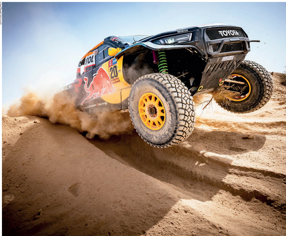
O brasileiro Lucas Moraes escala uma duna na Arábia Saudita

Confira ao lado apenas números e informações da 47ª edição do Rally Dakar: