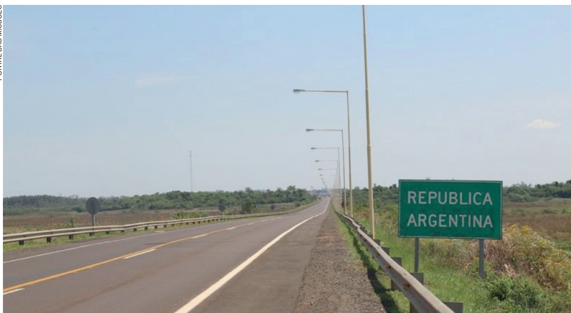
Além de sua importância comercial, a ponte facilita o trânsito diário de moradores e trabalhadores da região