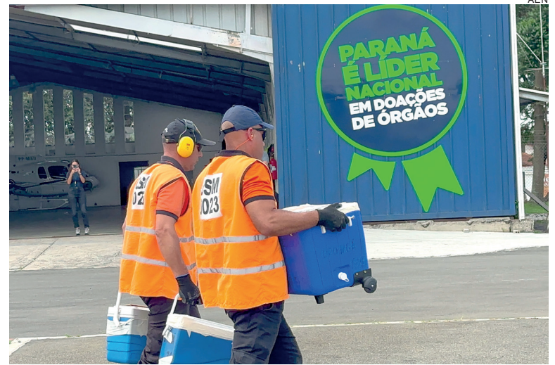
O Paraná teve também a menor taxa de recusa familiar do país

Nesse mesmo período de dez meses, o Paraná realizou 694 transplantes de órgãos sólidos, entre eles, coração, rim, pâncreas e fígado, um aumento de 11,75% em relação a 2019 – maior crescimento dos últimos anos. Entre os procedimentos, os transplantes cardíacos apresentaram o maior aumento percentual, 31 transplantes em 2024, aumento de 121,4% em comparação a 2019. Os