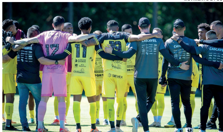
MOVIMENTO E FOCO

A estreia do FC Cascavel no Campeonato Paranaense