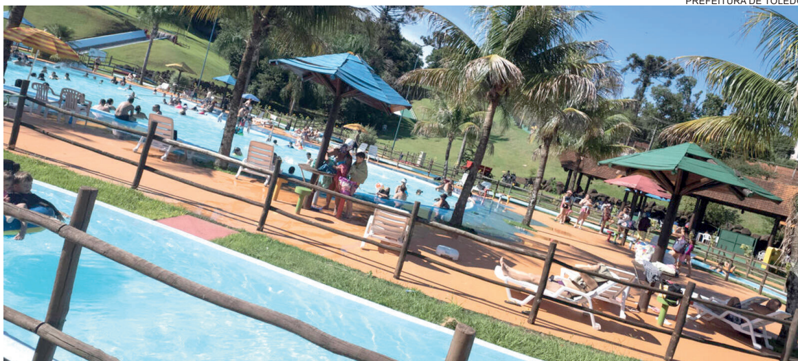
PREFEITURA DE TOLEDO

A entrada no parque é gratuita, sendo necessária apenas a apresentação de um exame médico. Menores de 18 anos de idade precisam estar acompanhados por um responsável,