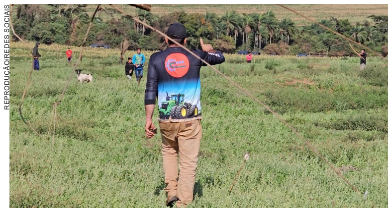
Em 2024, vários episódios de violência entre invasores “indígenas/paraguaios” e agricultores foram registrados

Diante da gravidade do cenário, a Justiça Federal determinou que a União, em conjunto com o Estado do Paraná, adote providências urgentes para garantir a segurança dos indígenas. A decisão judicial exige, entre outras medidas, o aumento imediato do efetivo da Polícia Federal, Força Nacional e Polícia Militar na região, enquanto persistirem