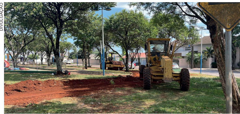
A mudança começou a ser feita neste fim de semana

A ciclovias da Rua Alexandre de Gusmão e as calçadas ainda não foram concluídas dentro do projeto geral da nova avenida, que já está com