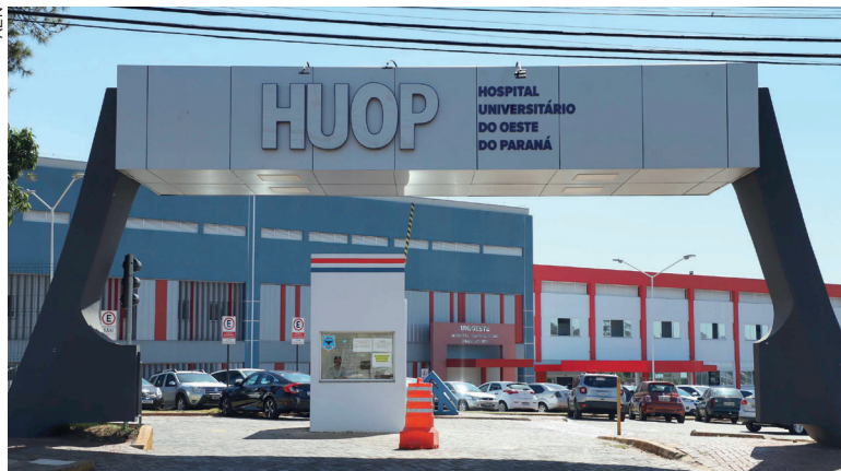
As cirurgias eletivas são realizadas na antiga Ala de Queimados do HUOP