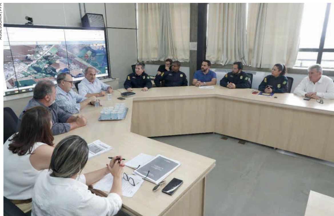
A base contará com infraestrutura especializada, incluindo um hangar para operações aéreas

A Base de Fronteira da PRF é uma instalação estratégica destinada a intensificar o combate ao crime em áreas estratégicas, com foco na região Oeste do Paraná, especialmente na cidade de Cascavel. Essa base contará com infraestrutura especializada, incluindo um hangar para operações aéreas, um canil para suporte em ações