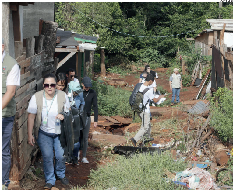
O mutirão começou ontem na Região Norte de Cascavel

Haidar reforçou ainda que isso não deve ser feito apenas na Região Norte, mas sim em toda a cidade que já tem também casos confirmados. “Ele disse ainda que estão desenvolvendo ações de tentativa de bloqueio, preventivas e com os agentes de endemias. Também está sendo passado o veneno em pontos específicos. “Já foram sete ciclos de