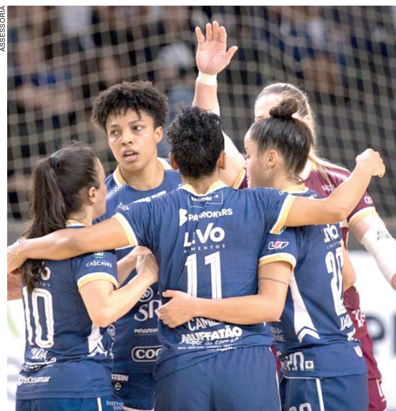
Stein prepara novo elenco para seguir caminho das conquistas no futsal feminino

na Venezuela. A partida é válida pela penúltima rodada e começa às 20h30. A Amarelinha está na quarta posição, com três pontos. O Grupo B é liderado pela Argentina, que soma sete pontos. Caso consiga a vitória hoje, o Brasil