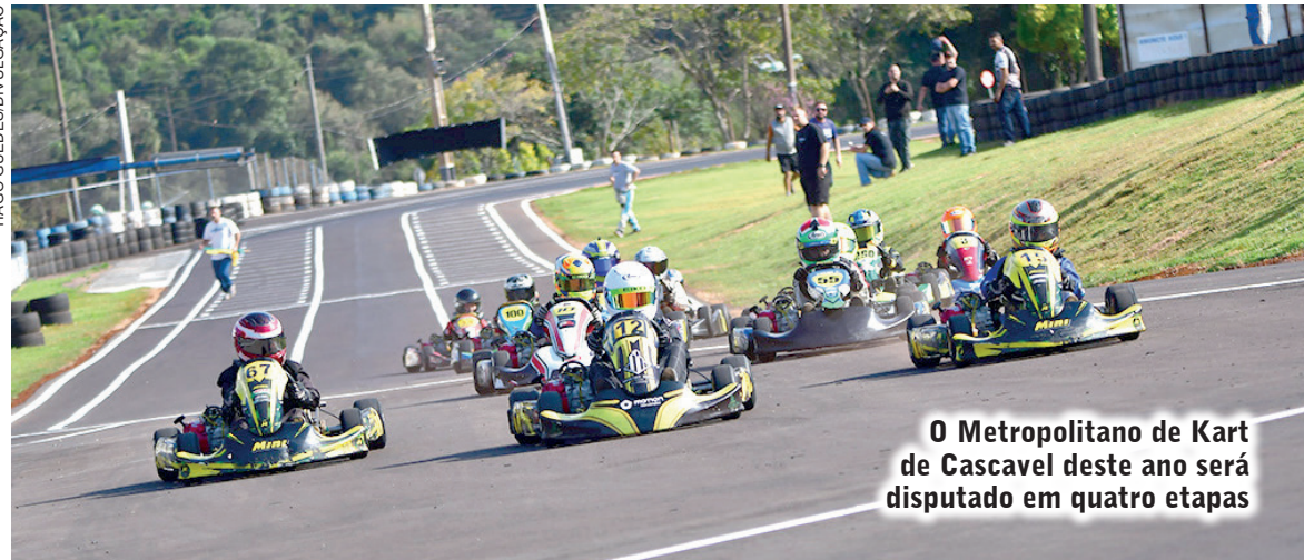
O Metropolitano de Kart de Cascavel deste ano será disputado em quatro etapas

Haverá premiação especial para aqueles que participarem de todas as etapas. Será