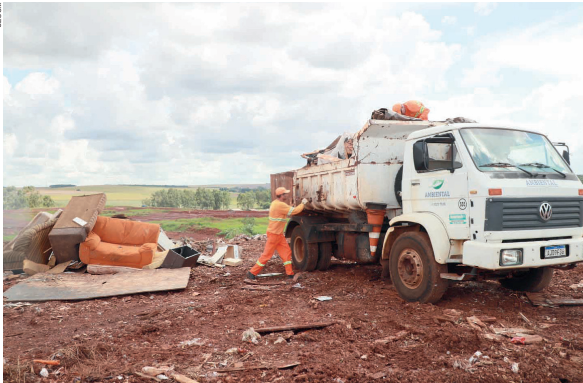
O aterro recebe cerca de 320 toneladas de lixo comum diariamente

O Aterro Sanitário de Cascavel, apenas de resíduo sólido urbano, ou seja, o lixo comum recebe cerca de 320 toneladas todos os dias. Além disso, recebe em média 50 toneladas de resíduos volumosos todos os meses. O que equivale a aproximadamente 130 cargas, caminhões carregados de material, que são retirados na sua grande maioria de destinação incorreta, de fundos de vale e lotes baldios e do agendamento da coleta de volumosos, que é feita pela equipe da