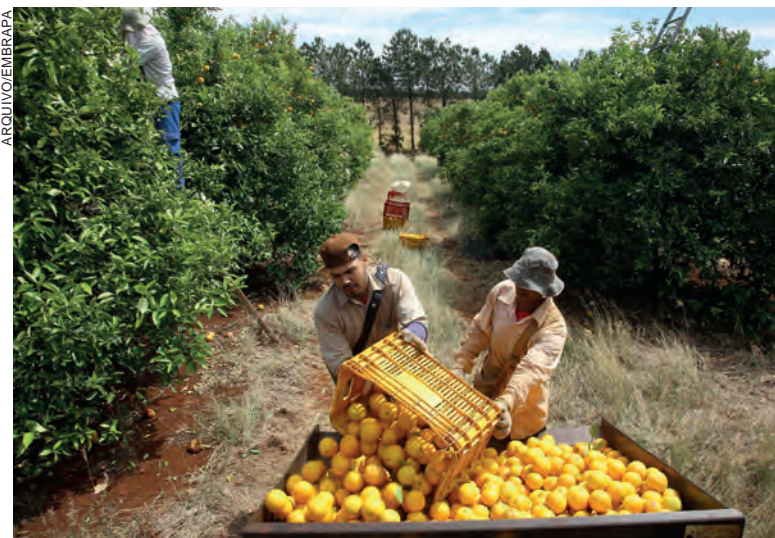
Lideranças apontam crescimento constante da produção, sem falta de produtos: "problema é falta de política econômica saudável"