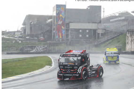
O cascavelense Edivan Monteiro foi a boa surpresa da sexta-feira em Interlagos ao levar seu Mercedes-Benz ao terceiro lugar

A programação para este sábado prevê para das 14h30 às 14h50, treino classificatório da GT Truck (grupo 1); das 15