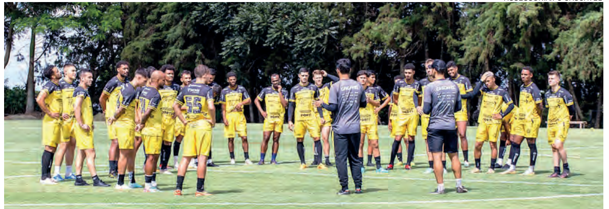
FC Cascavel faz jogo decisivo pela vaga na próxima fase; Rio Branco briga para não cair

Com todos os jogos no mesmo dia e horário, o Paranaense tem apenas duas vagas para serem definidas. Os candidatos com maiores chances são FC Cascavel e Azuriz, por dependerem apenas de seus resultados. Andraus e São Joseense também podem avançar, mas dependem de vencer o duelo