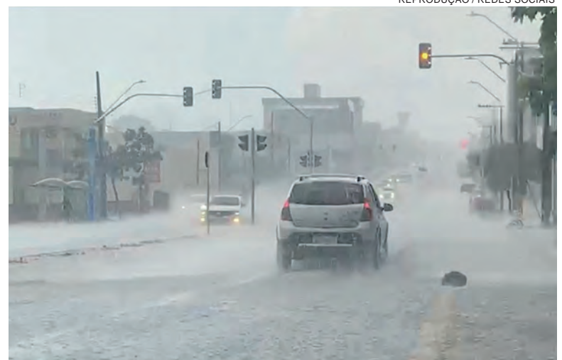
REPRODUÇÃO / REDES SOCIAIS

Na próxima semana será assinada a ordem de serviço para o início das obras na Rua Rio da Paz, que será transformada em binário com a Rua Rodrigues Alves e vai receber novo calçamento e nova intervenção na drenagem urbana. As obras fazem parte do pacote da revitalização da Carlos Gomes. O contrato para a pavimentação da Rio da Paz e das últimas quadras da Rua Academia, também no