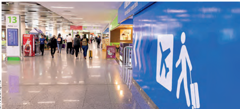
Os negócios são afetados diretamente pela obrigatoriedade do visto, já que a facilidade de entrada é um fator determinante para a realização de eventos e feiras internacionais

Assim como exigir o visto da tripulação aérea, contrariando o decreto de 1995 que segue uma convenção internacional de aviação, que compromete a operação das companhias estrangeiras. Caso o visto seja obrigatório para a substituição