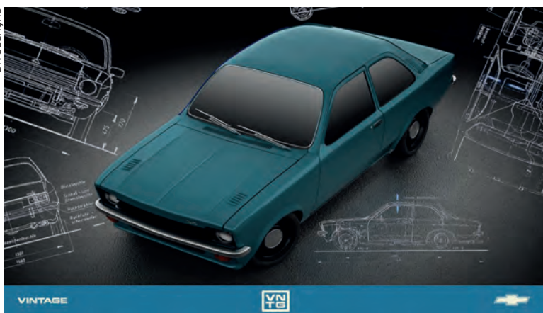
Batizado de Vintage, o programa é pensado para atender colecionadores e fãs da marca que buscam projetos exclusivos

Um dos projetos de restauração é o Monza Classic EF de 1990, o primeiro carro nacional da marca com injeção eletrônica. Entre os restomod, tem uma picape C10 de 1976 com mecânica de Camaro V8.