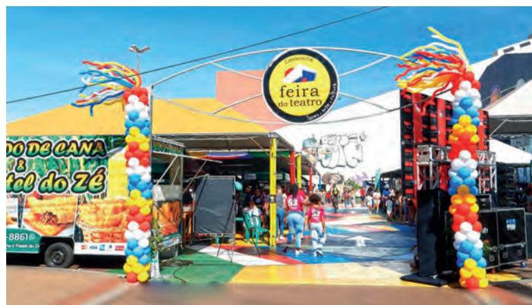
A feira é realizada no estacionamento do Teatro Municipal Sefrin Filho