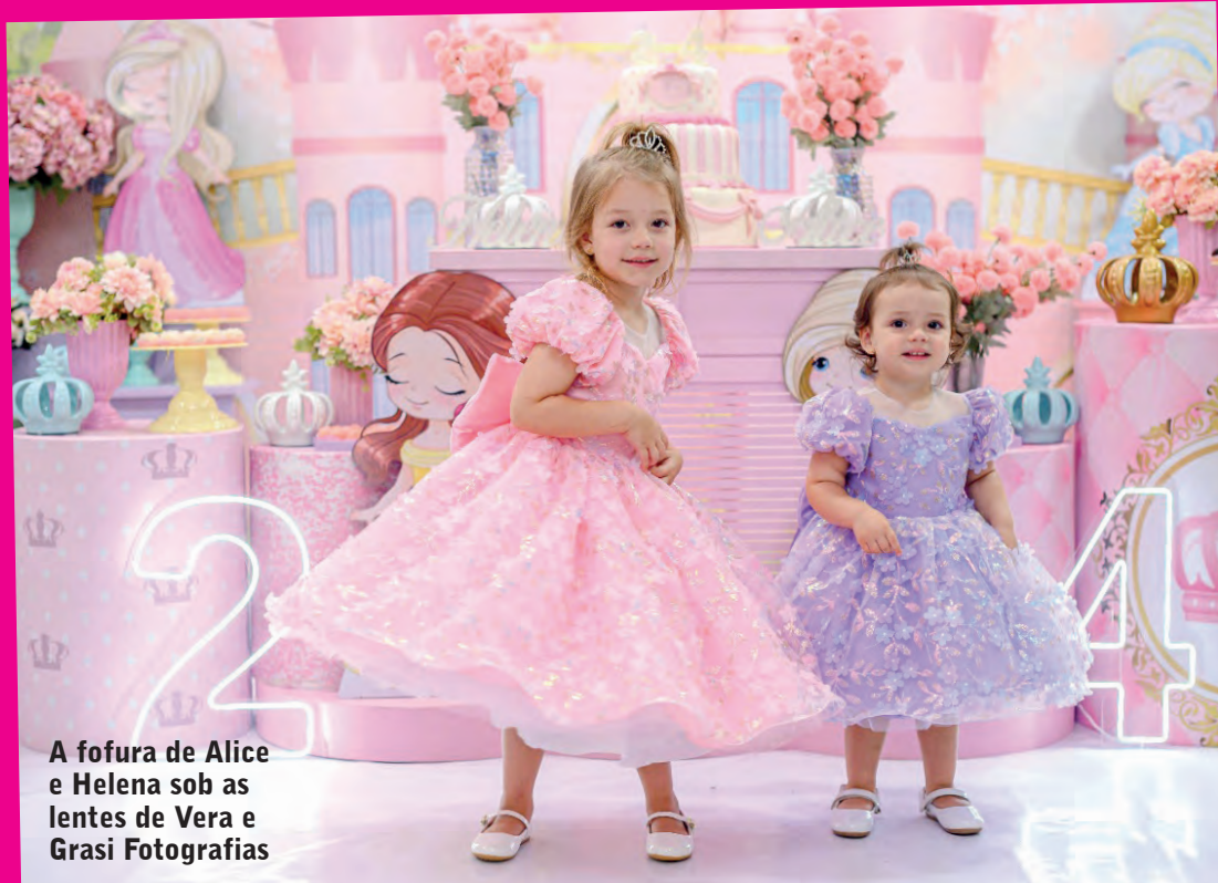
A fofura de Alice e Helena