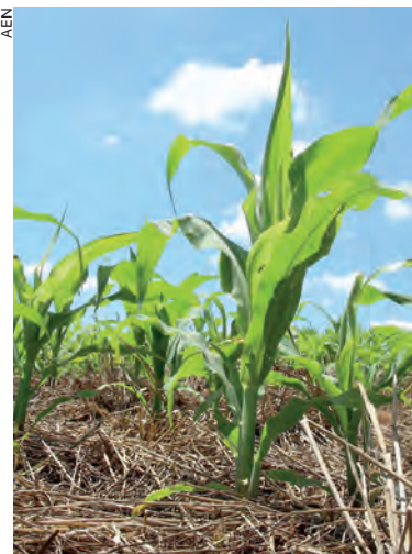
Corte dos financiamentos foi anunciado às portas da safra de inverno quando o maior volume do milho brasileiro é produzido