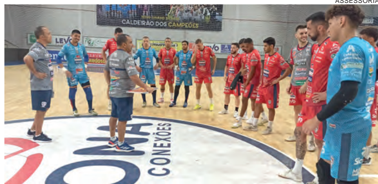
Cascavel Futsal encara o Foz para colocar a prova o trabalho que vem sendo realizado

O próximo compromisso do Cascavel Futsal será no dia 27, contra o Umuarama, na reinauguração do Ginásio São Cristóvão. Em termos de competições oficiais, o time tem como primeiro compromisso a Série Ouro, a partir de 15 de março, contra o São Miguel.