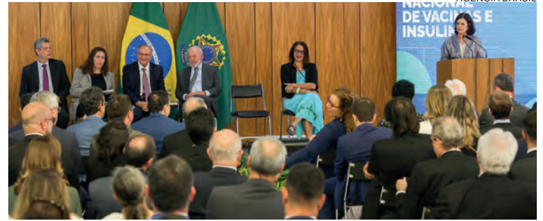
A previsão é que, a partir do próximo ano, sejam ofertadas 60 milhões de doses anuais

Segundo o governo federal, a partir de uma parceria entre o