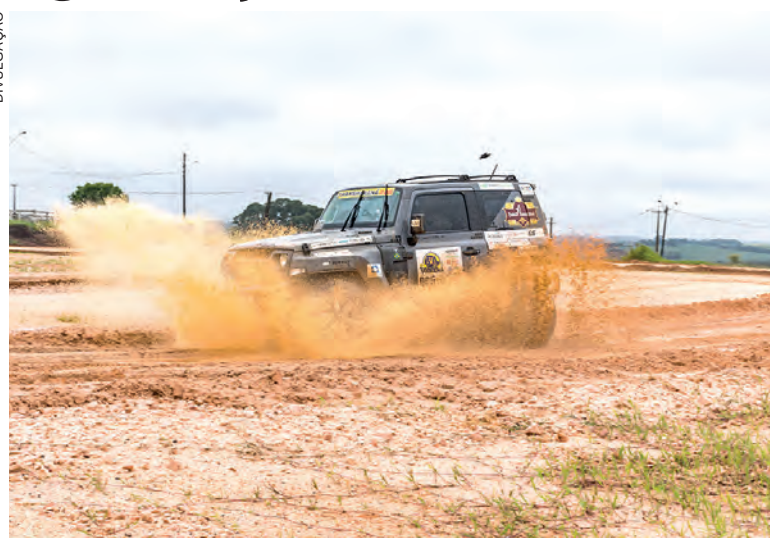
O 31º Transparaná, maior rali de regularidade do mundo, percorrerá mais de 2 mil quilômetros em 7 dias

No domingo (2), os pilotos aceleram a partir das 7h, saindo da Marina em direção a Campo Mourão. A premiação