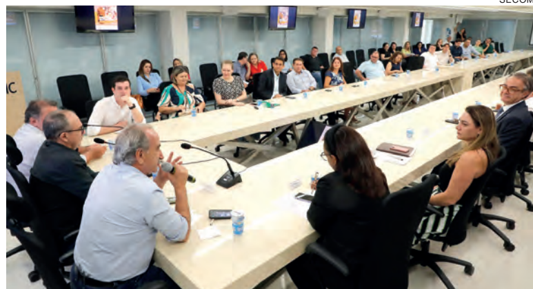
O lançamento da campanha aconteceu ontem na Acic

Para fazer a destinação do Imposto de Renda, o contribuinte precisa apenas se informar com o seu contador.