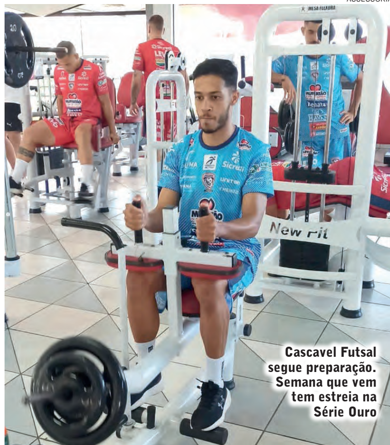
Cascavel Futsal segue preparação. Semana que vem tem estreia na Série Ouro