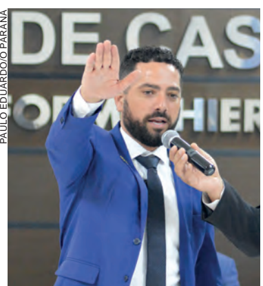
Denúncia contra o atual presidente da Câmara de Cascavel foi julgada improcedente