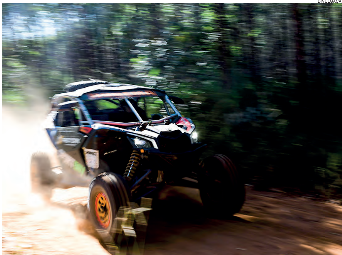
A categoria UTV superou todas as expectativas da organização