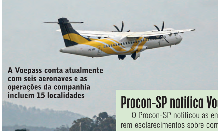
A Voepass conta atualmente com seis aeronaves e as operações da companhia incluem 15 localidades

descumprimento sistemático das exigências feitas pela agência.”