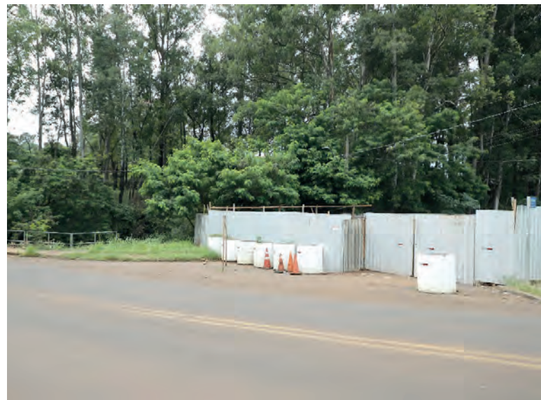
O trânsito da Rua Souza Naves Sul será interditado por tempo indeterminado

Devido a essa grande mudança de estrutura no local o projeto está sendo executado em duas etapas. A primeira etapa foi a construção das vigas de concreto naquela rua ao lado do córrego, ao todo, 22 vigas de concreto. A partir de agora, inicia a segunda fase e que terá mais transtornos à população que terá que enfrentar diariamente as mudanças. “Sabemos que obras dão transtorno, mas que depois de prontas, trarão muitos benefícios aos moradores”, disse.