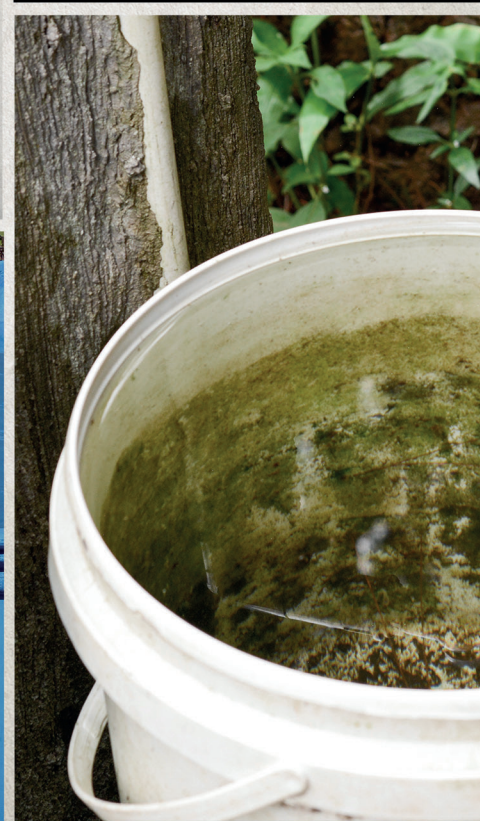
BALDE COM ÁGUA PARADA