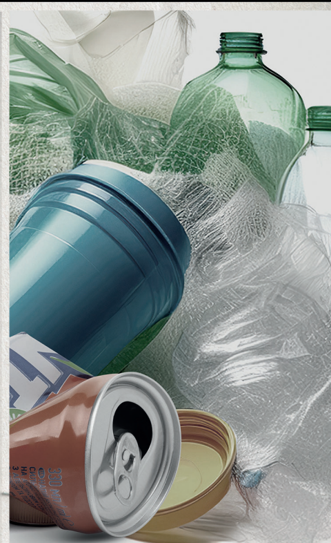
GARRAFAS E LATAS

EM CASO DE SINTOMAS, PROCURE UMA UNIDADE DE SAÚDE.