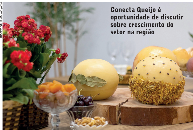
Conecta Queijo é oportunidade de discutir sobre crescimento do setor na região

pesquisa do IBGE (Instituto Brasileiro de Geografia e Estatística), divulgada em 2023, o Paraná é o segundo estado do País em produção de leite, com 4,56 bilhões de litros anuais, ficando atrás apenas de Minas Gerais, que produz 9,42 bilhões de litros. Essa posição tem impulsionado a produção de queijos finos. Por isso o principal objetivo do Conecta Queijo é aproximar esses produtores