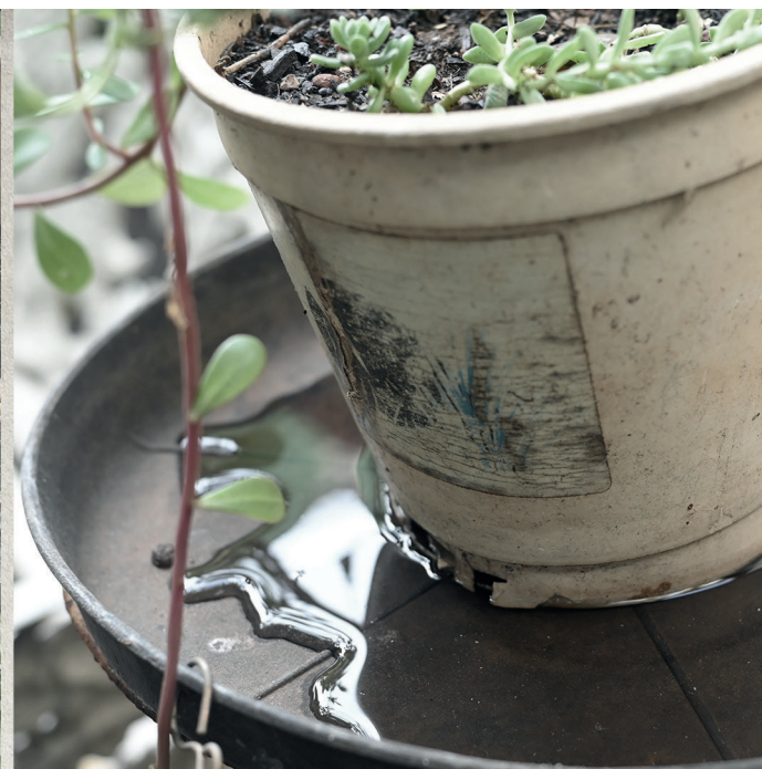
VASO COM ÁGUA PARADA