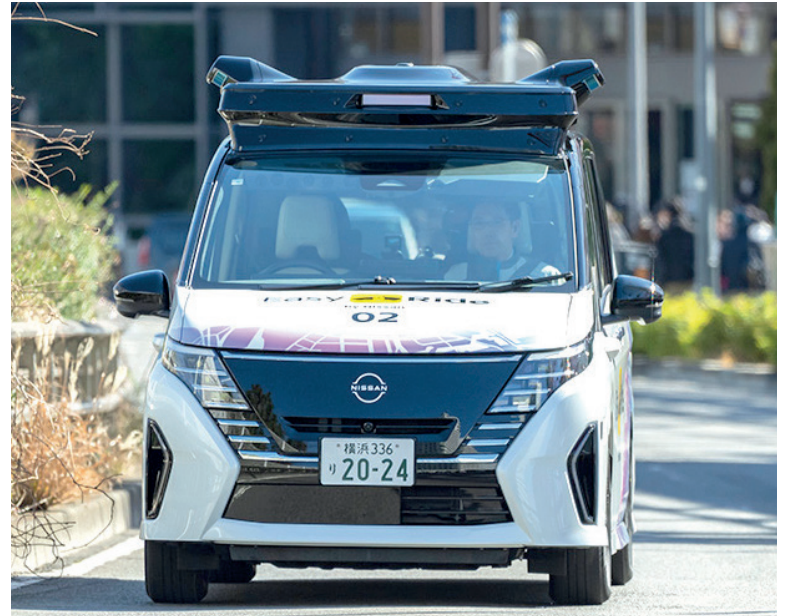
A Nissan está maximizando seus esforços para verificar a segurança da tecnologia às diferentes condições de tráfego em todo o mundo

Aproveitando os resultados dos testes, no ano fiscal 2027 a Nissan pretende fornecer serviços de mobilidade para condução autônoma, em colaboração com municípios e operadores de transporte, com monitoramento remoto.