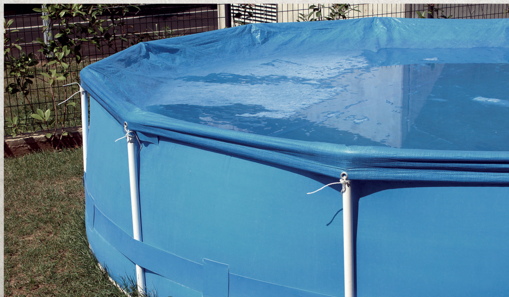
ÁGUA PARADA DE PISCINA