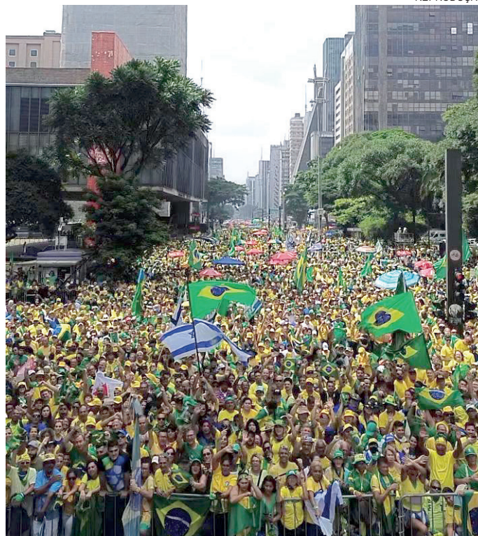
Em fevereiro de 2024, ato convocado por Bolsonaro em São Paulo, reuniu milhares de pessoas e impulsionou vitória da direita nas eleições municipais

Durante a semana, Bolsonaro defendeu o projeto de lei que anistia ao lado do