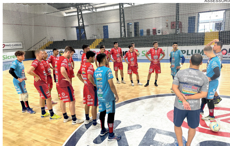
Após quase dois meses de treinos, Cascavel estreia no Paranaense

A rodada de abertura da Série Ouro tem mais quatro jogos neste final de semana. O Pato Futsal recebe o ABF/Beltrão, que subiu da Série Prata e espera ser o mais novo rival no sudoeste. Em Guarapuava, o CAD enfrenta outro estreante, o Manoel Ribas. Já o Marreco joga em casa contra o Ampére. No domingo, será a vez do Campo Mourão enfrentar Chopinzinho.