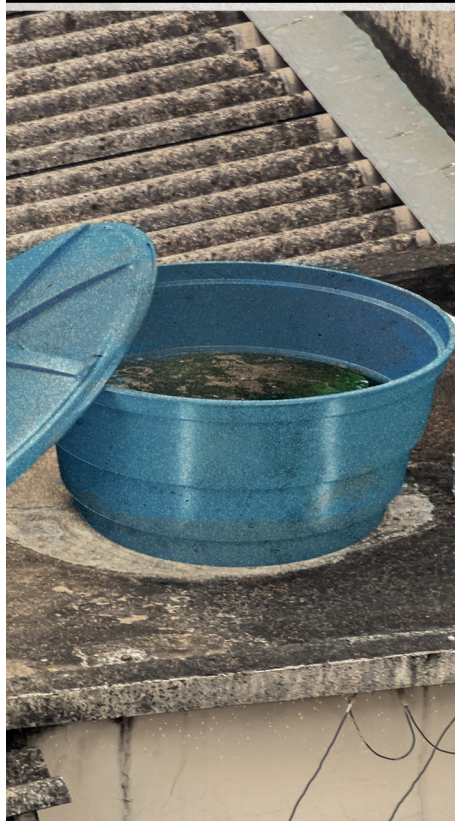
CAIXA D'ÁGUA ABERTA