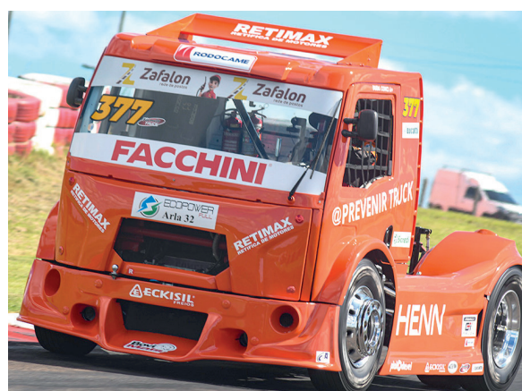
Duda Conci, de Cafelândia, foi o terceiro melhor da sexta-feira na categoria F-Truck

DOMÍNIO PARANAENSE A categoria F-Truck (motores com bomba injetora) teve domínio paranaense. Márcio Rampon, de Curitiba, fez o melhor tempo com a marca de 1m40s402, o segundo colocado foi Thiago Mânica, também de Curitiba, com 1m41s947, enquanto que Duda Conci, de Cafelândia, foi o terceiro mais rápido da sexta-feira, com 1m42s019.