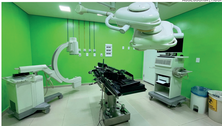
A nova sala cirúrgica deve dar ainda mais agilidade aos atendimentos de pacientes que aguardam na fila e liberar leitos para quem chega ao PS