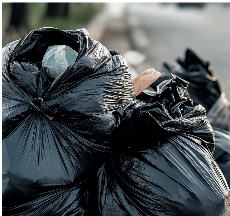
SACO DE LIXO ABERTO