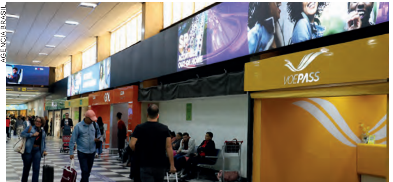
Desde o último dia 11, a Anac suspendeu as operações da Voepass

“O luto tem se transformado em luta. Não foi uma fatalidade, não foi um acidente, foi um crime premeditado, no sentido