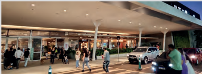
CATUAÍ – Tem até Super Mercado moderno – bonito – elegante e muito prático – O admirável FESTVAL

Pela primeira vez, desde que inaugurou, visitei o Shopping Catuaí, aqui em Cascavel. E faço esse registro nesta coluna em foto abaixo, mostrando a elegância daquele local e sem nenhuma vinculação publicitária e o faço congratulando-me pelo fato de me ter negado a aceitar a recomendação, certa ocasião, de por meio de som e imagem - “bater pesado” na obra - quando em fase de construção. Uma insensatez que está registrada em E-Mail em poder desta Coluna.