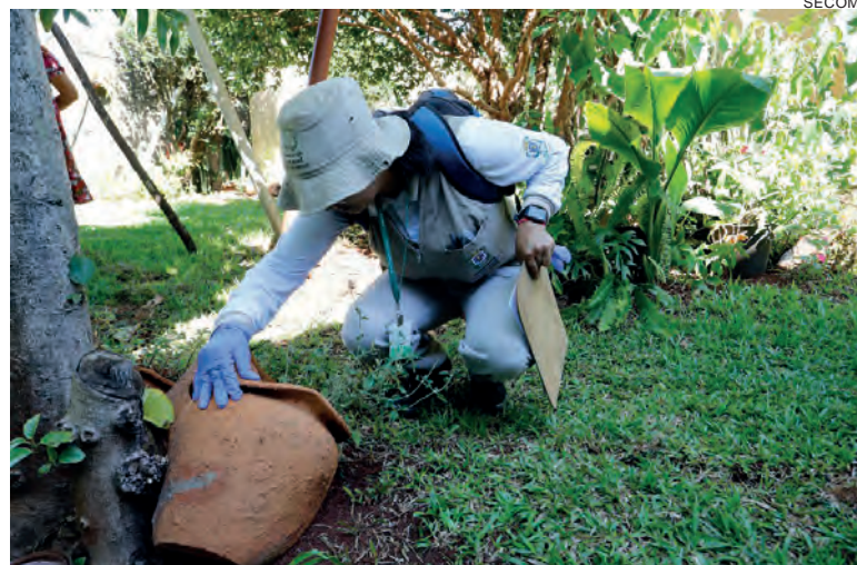
A Secretaria de Saúde pede colaboração na recepção dos agentes de Endemias para a realização da vistoria

Cascavel continua liderando o número de casos de todo o Estado, que pelo boletim estadual tem 595 casos