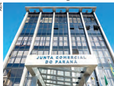
A agilidade desse processo colocou o Paraná entre os cinco estados mais rápidos nesse quesito no Brasil

O Paraná passou de 5º lugar no ranking nacional em fevereiro para 1º lugar, registrando o tempo médio de 1 hora e 58 minutos para a realização desse processo. Os outros