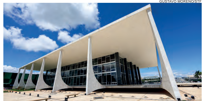
A Corte passa a entender que a inspeção das cavidades corporais e o desnudamento de amigos e parentes de presos sem justificativa é “inadmissível”

Apesar da proibição, a Corte entendeu que a administração dos presídios pode negar a entrada de visitantes que não aceitaram passar por nenhum tipo de revista. Contudo, a inspeção deve ser justificada com base em suspeitas de porte de objetos ilegais, denúncias anônimas e